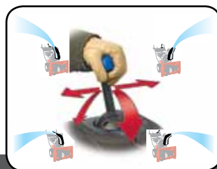
Quick Stick® Kidobócső-vezérlés

A fogantyúra szerelt kezelőszervek révén a kerekek egyikét, vagy akár mindkettőt is leválaszthatja a hajtásról, ilyen módon könnyű a kormányzás és a manőverezés.