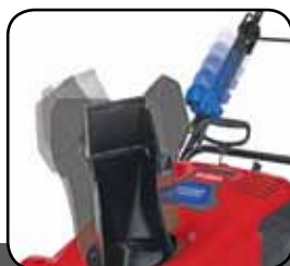
Quick Shoot™ vezérlőrendszer