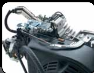
Nagyobb kihasználható erő, nagyobb sebesség

Mindez annak a hagyománynak a része, amely még 1914-ben kezdődött, amikor a Toro motorgyártó vállalként elkezdte működését az USA Minnesota államában. Több mint 90 év tapasztalattal a gyepterületén a Toro mindennél elkötelezettebb olyan termékek gyártása iránt, amelyekre mindig számíthat.