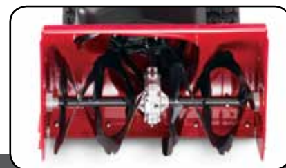
36 cm-es fogazott marócsiga

Maximális erőt biztosít a legnehezebb hófúvások és a bejárók végén lévő hótarajok kezeléséhez.