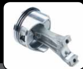
Három dugattyúgyűrűs kivitel

Két túlméretes főtengelycsapágó a kisebb sűrűlódás és hosszabb élettartam érdekében.