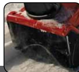
Power Curve® rotor

Nem kell többé tolni vagy emelgetni. A Toro motoros hajtásrendszer átvállalja a hómarással járó munkát.